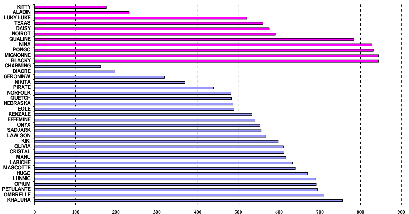
Octobre 2010 à Septembre 2011 - Heures de monte

Khalula toujours en tête pour les chevaux avec un total de 756 heures cette année contre 674 heures l'année précédente.